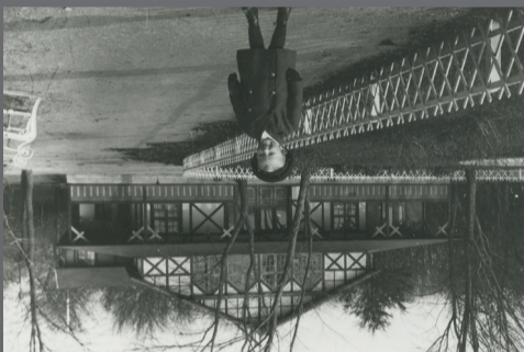
Pavillonen ca. 1915

Kløverstierne i Danmark er blevet til i et samarbejde mellem Danmarks Idræts-Forbund, Danske Gymnastik- og Idrætsforeninger, Dansk Firma-Idrætsforbund, Fritidsrådet og 10 pilotkommuner i 2011. Udviklingen af stierne er finansieret af Norddeutsches Landesmuseum til Fritidslivs- og Lottomidlerne til Fritidsliv. Mere information om Kløverstierne, deres forløb og seværdigheder kan findes via