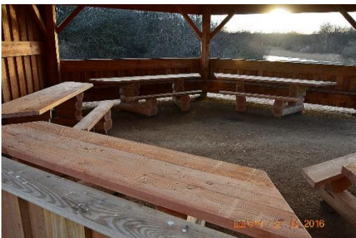
Billede 2, Sejlbjerg Mose - borde i madpakkehus