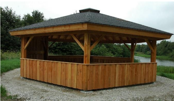
Billede 2, Sejlbjerg Mose - borde i madpakkehus