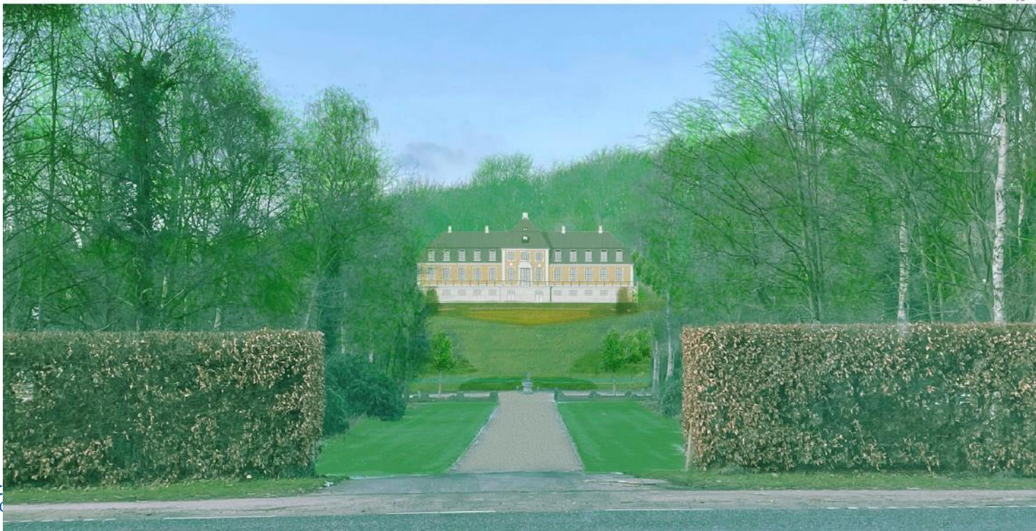
Figur 23 Den fremtidige hovedbygning