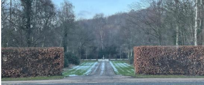
Figur 22 Rathlousdal 2020