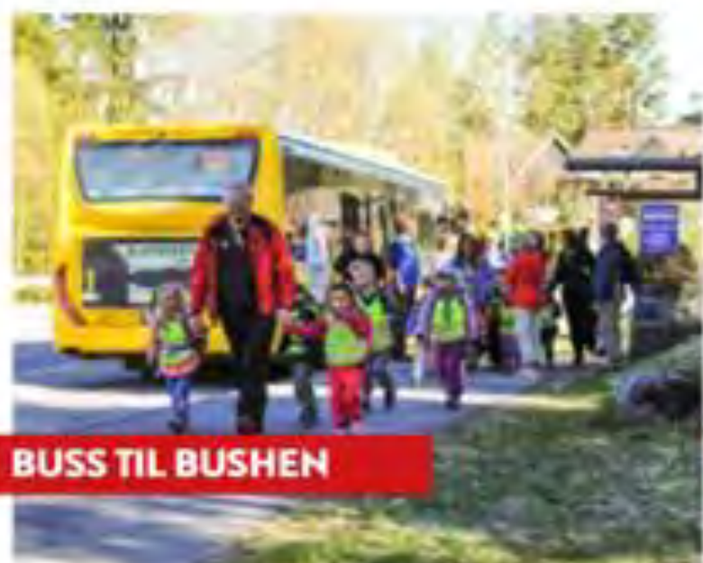
BUSS TIL BUSHEN