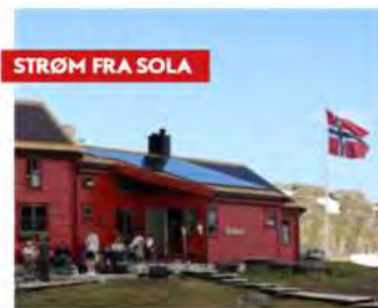
STRØM FRA SOLA