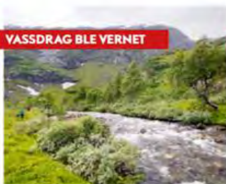
YASSDRAG BLE VERNET