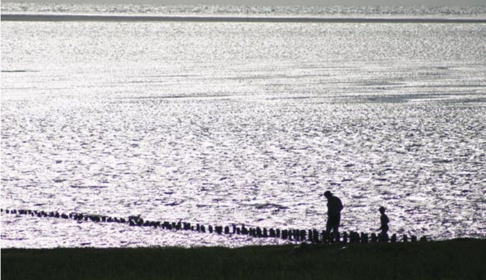
Samspillet mellem land og hav bliver et væsentligt indhold i den foreslåede nationalpark i Vadehavet.

IUCN's kategori II er i dette hæfte tilpasset danske forhold. I de fleste tilfælde vil kun kerneområderne i en dansk nationalpark leve op til kravene i IUCN's definition af en nationalpark, der lyder sådan: "Naturligt land- eller vandområde, udpeget for at (a) beskytte den økologiske helhed af et eller flere økosystemer for nuværende og fremtidige generationer, (b) udelukke udnyttelse eller erhverv som er skadelig for formålet med udpegningen af området, og (c) skabe et fundament for åndelige, videnskabelige, uddannelsesmæssige og rekreative muligheder, som alle skal være miljømæssigt og kulturelt forenelige."