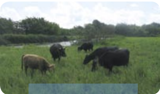
Dexter-køer vejer mindre end andre kvægracer og er velegnede til naturpleje på våde arealer.