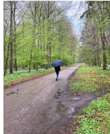
Refleksion i regn

Erfaringsbaserede: Kropslig og fysisk interaktion med natur. Eleverne kommer ud i naturen og skal gøre sig erfaringer med at indsamle planter og urter, lave mad i naturen og at kunne dække sig i tilfælde af regn ved at kunne sætte en presenning op. Kognitive: Viden og holdninger. Eleverne danner en forståelse og kendskab til de forskellige fundne plantearter og urter, samt lærer at benytte dem i mad. Følelsesmæssige: Emotionelle reaktioner og tilknytning. Elevernes oplevelse i forløbet skaber følelser og tilknytning til naturen ved, at de kan omgås i den samtidig med at de får et udbytte af naturens ressourcer.