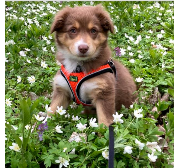
Hvalp naturdannes i Boserups blomsterflor 😊