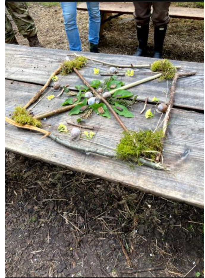
Spejling og landart