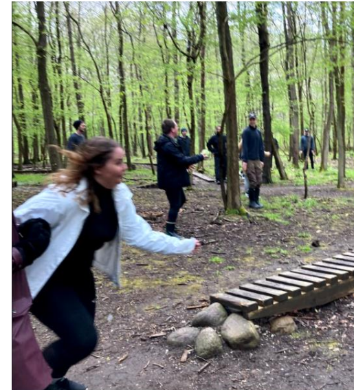
Idræt i spil