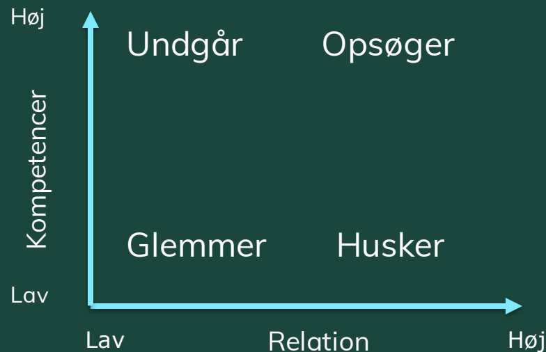
Figur efter Maria Steno