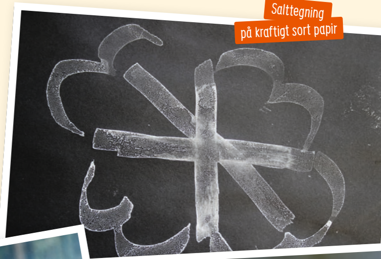
Salttegning på kraftigt sort papir

I skal lave saltvandsblanding af ca. to dl. vand og ½ dl. salt. Lad børnene være med til at lave blandingen, så de er bevidste om, hvad den består af. Husk at smage på vandet, på saltet og til sidst på saltvandet. Kom saltet i lidt ad gangen, og bliv ved med at røre rundt i vandet til saltet er opløst, før der kommer mere salt i. Fint salt er hurtigere at opløse end groft salt. Det gør ikke noget, hvis der er lidt bundfald.