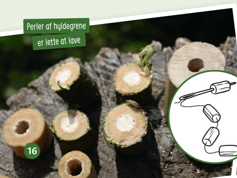
Perler af hyldegrene er lette at lave

Processen er enkel, men tager lidt tid. Barnet skræller et æble, og en voksen hjælper med at fjerne kernehuset, så der bliver et hul ned igennem æblet. Der laves huller til øjne og mund i æblet. Der sættes øjne i øjenhulerne, fx skrues eller metalsplits til at lukke kuverter med. Giv dem en sort prik med tusch. Perler, nåle eller andet kan også bruges. En tot uld eller garn stikkes ned i hullet som hår. Til sidst stilles de tørt og varmt. Efter en uge på en radiator er æblerne blevet tørre og hårde. Hullet i midten sikrer, at æblet også tørrer indefra. Husk navneseddel, da de bliver ganske uigenkendelige.