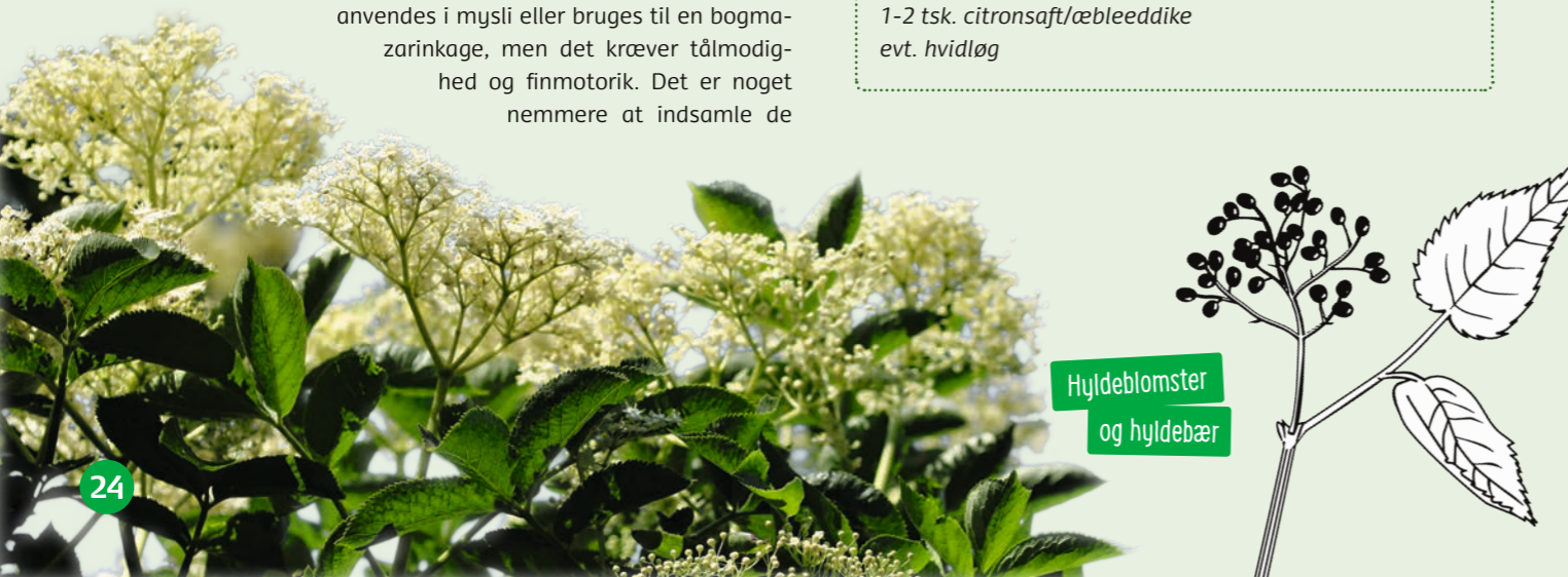
Hyldeblomster og hyldebær

1 l. frisk blæretang 2 spsk. revet parmesan 2 spsk. ristede solsikkekerner/hasselnødder 1-2 dl. rapsolie 1-2 tsk. citronsaft/æbleeddike evt. hvidløg