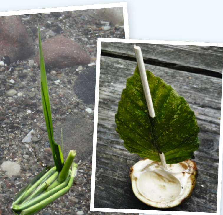
Sjov med små både

Uanset om det er en stillestående sø, bølgende havvand eller en strømmende å, så er det sjovt at bygge små både, der kan flyde på vandet. Tag lidt materialer med hjemmefra, eller brug hvad I kan finde på stedet. Undersøg forskellige materialer: Kan de flyde, kan de bære gods, og kan de holde til længere ture over vandet? For de mindste er det særligt sjovt at løbe frem og tilbage på en bro og se skibende komme sejlene ud under broen.