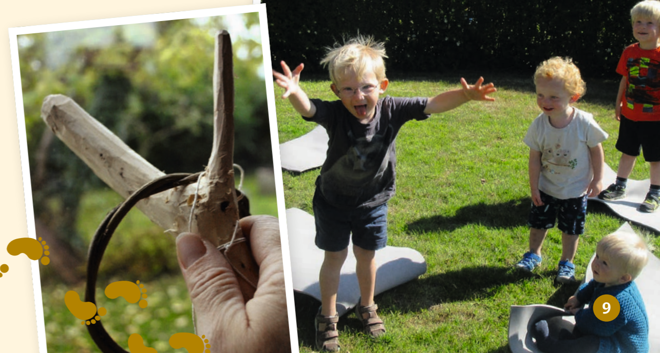
Ringspil og andre lege styrker muskel-ledsansen

holde om snoren hele tiden med højre hånd og gå banen igennem. Man kan udvikle legen ved at lægge fem ting på ruten, som ikke hører til i naturen, og som skal huskes og opremses, når man når til vejs ende. Følg-rebet-aktiviteten kan gøres sværere ved at børnene gennemfører med bind for øjnene. Man kan også hænge ting på snoren, som de skal mærke på og gætte.