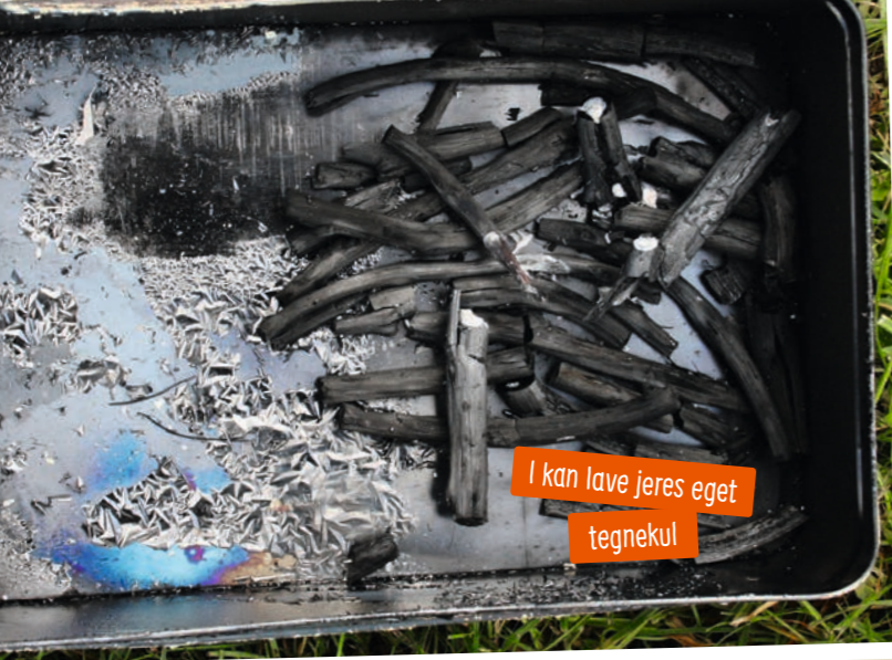
I kan lave jeres eget tegnekul