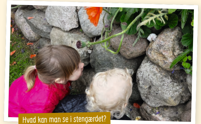
Hvad kan man se i stengærdet?

Ved at lave børnekikkerter af paprør, kan I reducere synsfeltet og dermed fokusere på forskellige genstande. Hvis man ligger på ryggen og kigger op i himlen, bliver man pludselig opmærksom på skyerne på en helt anden måde. Hvad ligner skyerne?