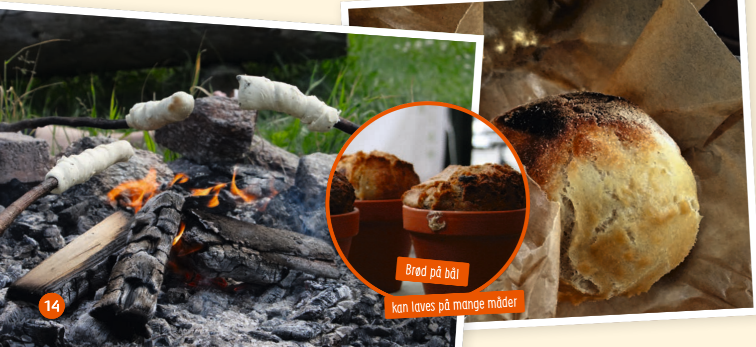
Brød på bål kan laves på mange måder