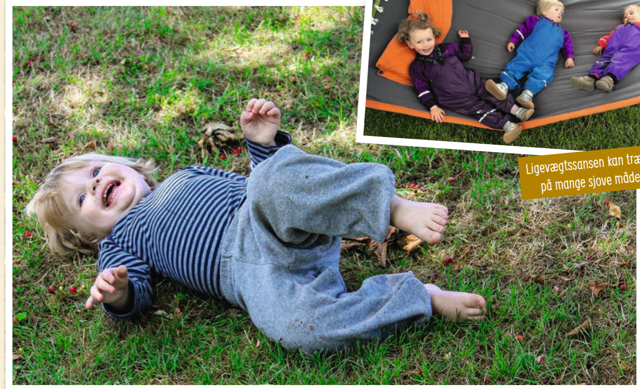
Ligevægtssansen kan trænes på mange sjove måder!

Tag et reb med i skoven eller ud på legepladsen. Sving det op over en tyk gren og bind den ene ende fast