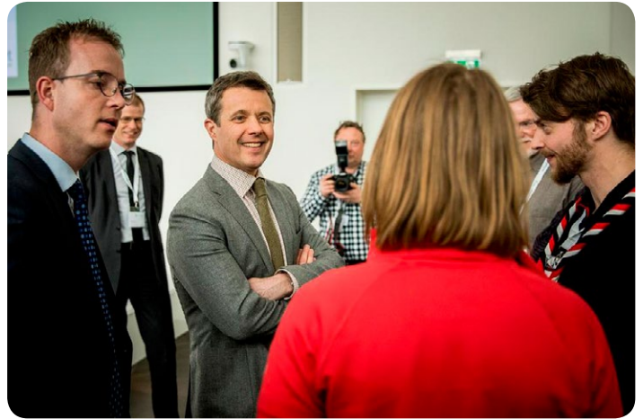
Repræsentanter fra Det Danske Spejderkorps og Dansk Vandrelaug fik en snak med Kronprins Frederik og miljø- og fødevareministeren om organisationernes aktiviteter.