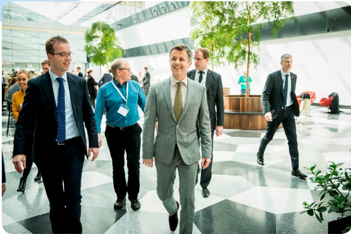
Både Hans Kongelige Højhed Kronprins Frederik og miljø- og fødevareminister Esben Lunde Larsen var i højt humør og lykønskede Friluftsrådet med jubilæet fra talerstolen.

To dage før selve jubilæumsdagen den 27. november blev jubilæet fejret af bestyrelsen, kredsformændene og sekretariatet med en festlighed i Odense.