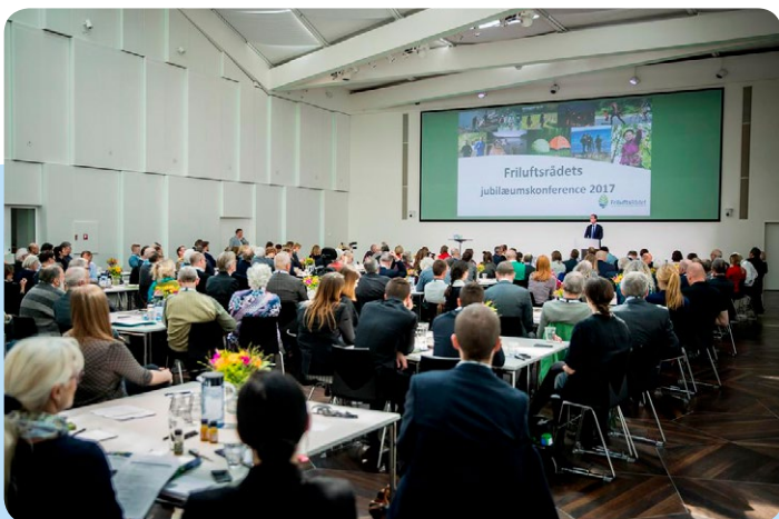
Medlemsorganisationer og gæster lytter til miljø- og fødevareministerens karakteristik af Friluftsrådet: "Friluftsrådet er en ældre dame, der stadig i dag spiller en central rolle, som en vidende, insisterende og ambitiøs samarbejdspartner. Vi har et fælles mål om mere og bedre friluftsliv i Danmark. Tak for engagementet i trekvart århundredes danmarkshistorie. Jeg håber, at I tager endnu et århundrede med"