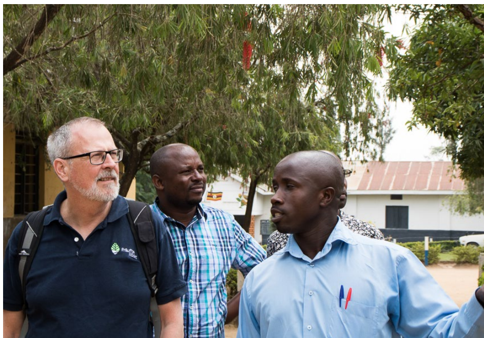
Langt over 100.000 elever er direkte involveret.

Arbejdet gennemføres i samarbejde med lokale NGO-partnere og myndigheder på nationalt og centralt niveau med særlig