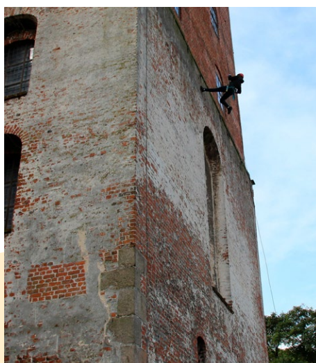
Næstformand i Friluftsrådet Helle Stuart åbnede begivenheden ved at rappelle 60 meter ned fra Koldinghus.