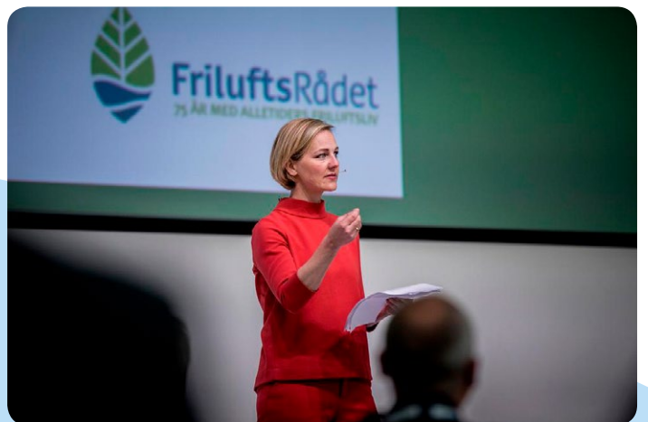
Konferencens hovedtaler, tidligere miljøminister Ida Auken, leverede pointer med stor skarphed og stor underholdningsværdi. Hun gav blandt andet gode råd til, hvordan friluftsliv kan fremmes ved at udnytte forskellige politiske dagsordener, for eksempel sundhed og økonomisk vækst.