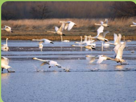
Sangsvaner i Kolind Engso