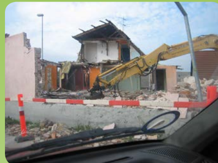
Det gamle cafeteria og diskoteque rives ned

gennem Kulkanalen havde forbindelse til kanalerne i Sundet. Her i stationsområdet har de første ”Kolinesere” (stenalderfolkene) boet. Her har man fundet store køkkenmøddinger.