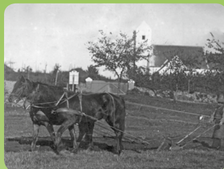
Den gamle Kolind Kirke fra før 1918