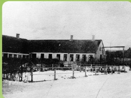
Kolinds gamle skole på Nødagervej

Senere ændres vandretningen, så vandet løb mod Grenå. Her udgravedes også en dal, som havde forbindelse til havet. Da isen var bortsmeltet lå, der derfor en fjord tilbage. Den har fået navnet "Kolindsund".