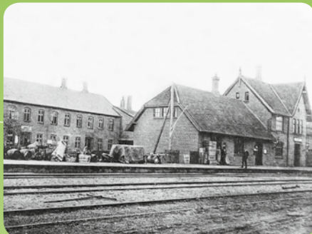
Kolind Station ca. 1920