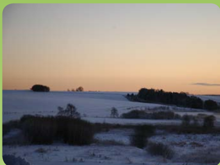
Udsigt over Kolind enge