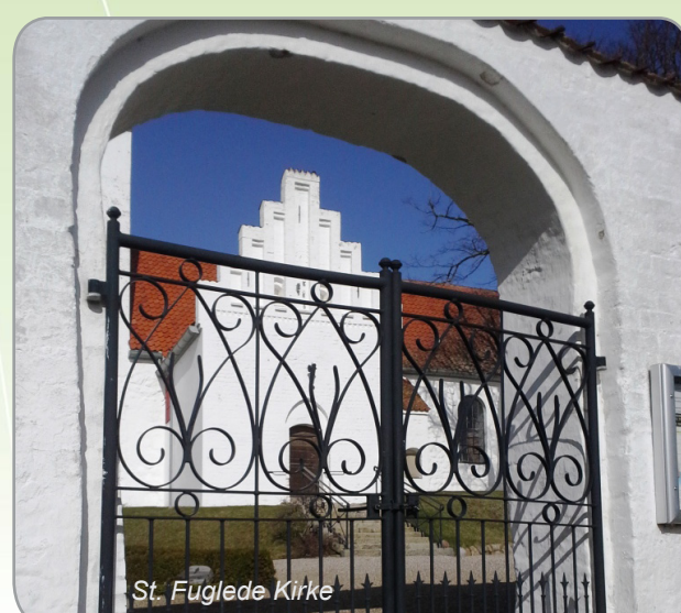
St. Fuglede Kirke

endomondo.com og endomondo mobil app, der kan hentes gratis i App Store og på Android Marked.