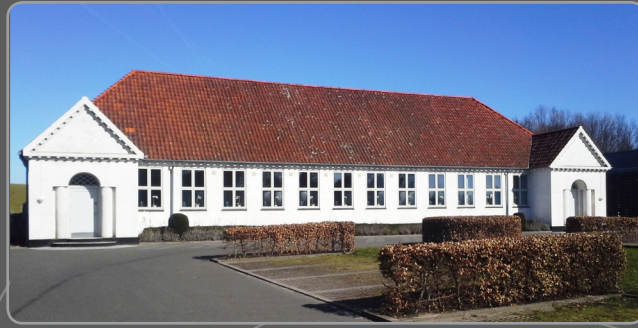
Ubby Kultur- og Forsamlingshus