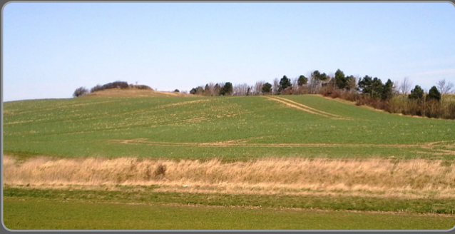
Rishøj set fra Bredsten