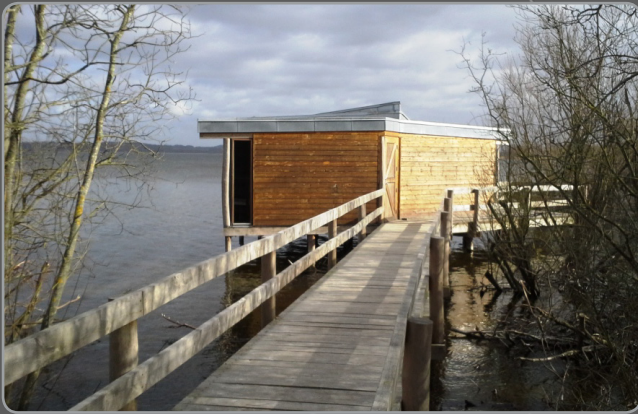
Fugleskjul ved Tissø (Formidlingscenter Fugledegård)