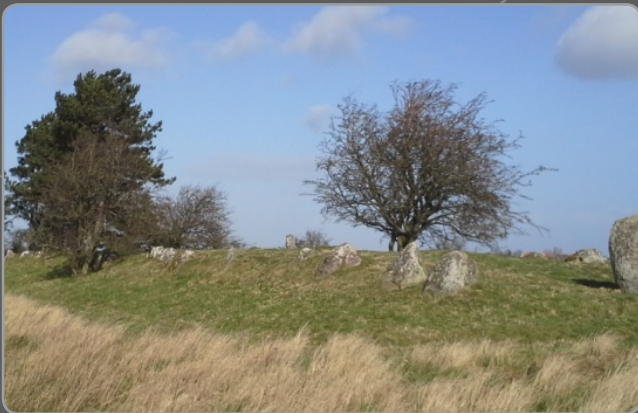
Langdysse ved Tystrup