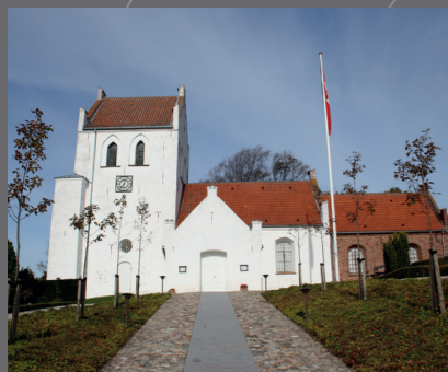
Ramløse Kirke set fra vejen.