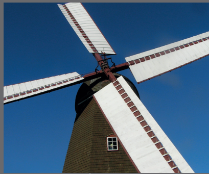
Ramløse Mølle som er et besøg værd.