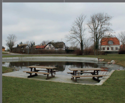
Den gamle bydel i Ramløse ved gadekæret.