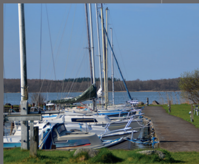
Ramløse Havn med lystbådene.