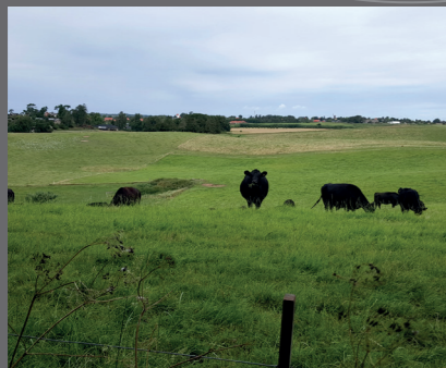
Udsigt fra Søbjergbakken til Ramløse by.