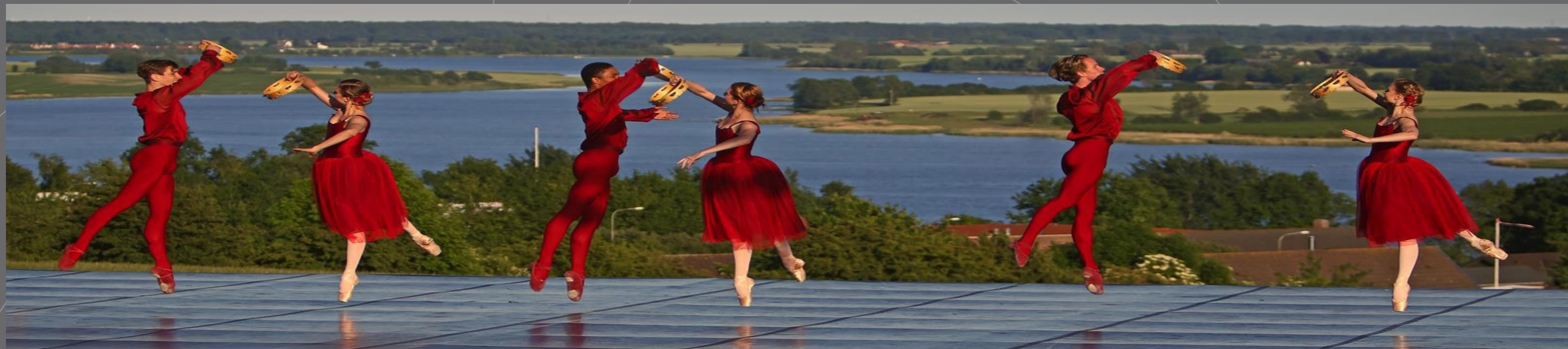
Ballet på Munkebo Bakke (2014)