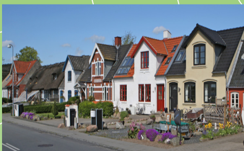
Husrække på Fjordvej