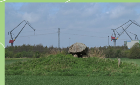
Runddysse ved Fiskeløkken