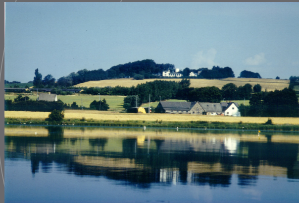
Munkebo Bakke set fra Skålholm