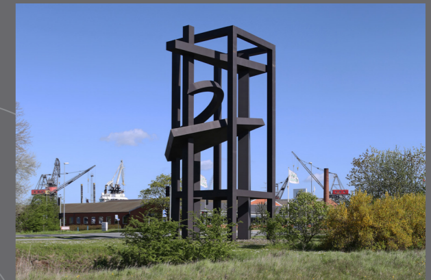
Robert Jacobsen skulpturen