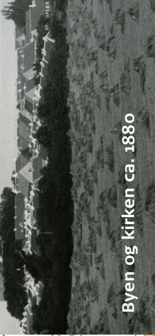
Byen og kirken ca. 1880