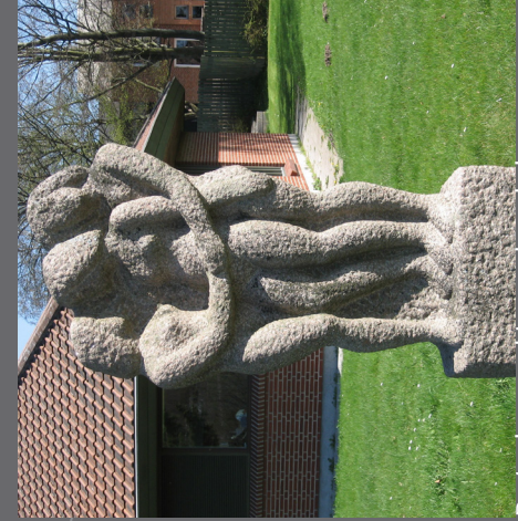
De tre børn ved Langeskov skole