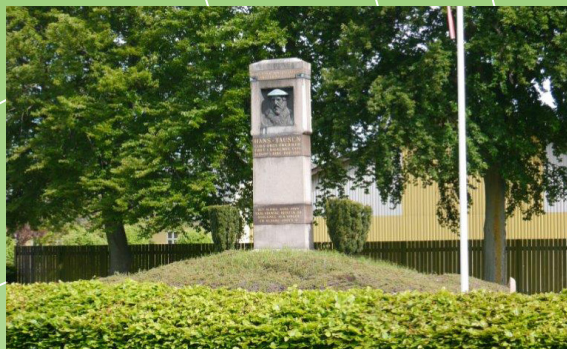
Hans Tausen statuen i Birkende