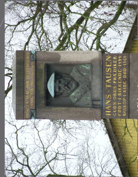
Hans Tausen statuen i Birkende

Kløverstierne starter på torvet ved Prekestolen på sydsiden af Langeskov centeret