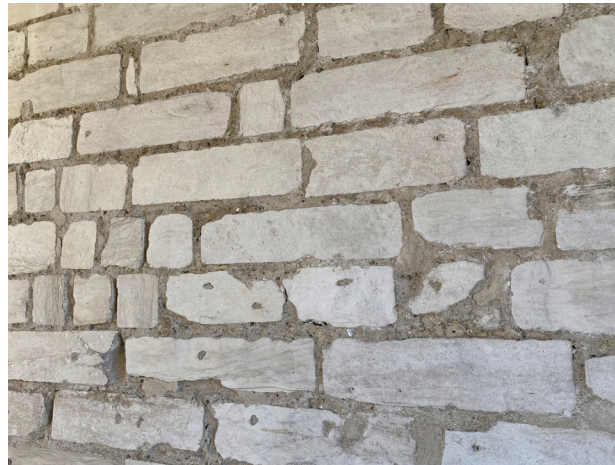
december 2022.