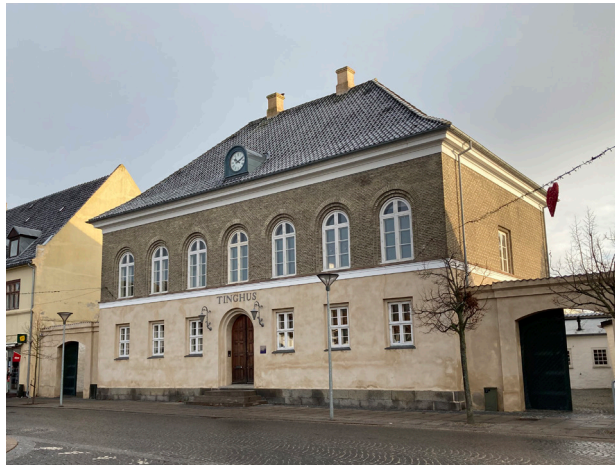
december 2022.

VÆLG DEN RUTE, DER PASSER DIG I FORHOLD TIL LÆNGDE ELLER INTERESSE-PUNKTER. DE FIRE FORSKELLIGE RUTER - GRØN, RØD, BLÅ OG SORT - ER FRA GODT 3 TIL 12 KM.