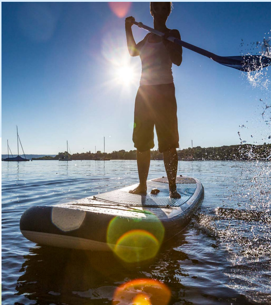
Med 2,3 millioner kroner fra Udlodningsmidler til Friluftsliv under temaet "Friluftsliv skaber sundhed" vil Dansk Surf & Rafting Forbund skabe livskvalitet for stress-, angst- og depressionsramte danskere.

Involveringen kan eksempelvis ske gennem workshops, hvor relevante aktører mødes for at dele erfaringer, idéudvikle på tværs eller udforske nye samarbejdsformer. I 2019 har Friluftsrådet endvidere udviklet en mere systematisk tilgang til evaluering og effektmåling af de projekter, der får støtte.